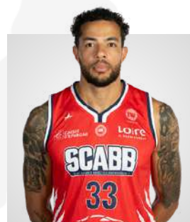
JITO KOK POSTE 5